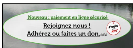
Page d'accueil du site