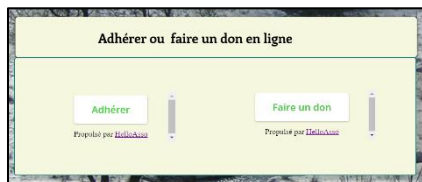
Menu : qui sommes-nous ? puis adhésion et dons

Le paiement en ligne est ouvert à partir du site internet de l'association ( https://www.eolien-en-correze.fr/ ) sur un mode totalement sécurisé grâce à un partenariat avec Helloasso, association qui assure cette fonction pour un très grand nombre d'associations comme la nôtre.