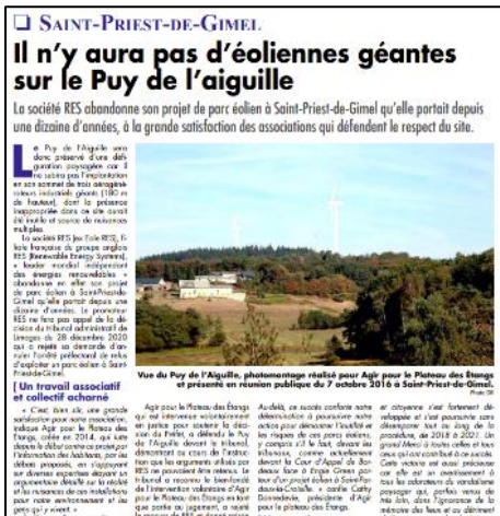
La Vie Corrèzienne du 2 avril 2021

Suite au recours lancé par le promoteur RES contre l'arrêté du préfet refusant l'autorisation d'exploiter 3 éoliennes au sommet du Puy de l'Aiguille, le tribunal administratif de Limoges a décidé le 28 décembre que l'intervention volontaire de notre association en soutien au préfet était bien admise (alors que RES voulait démontrer son irrecevabilité) et de rejeter la requête de RES .