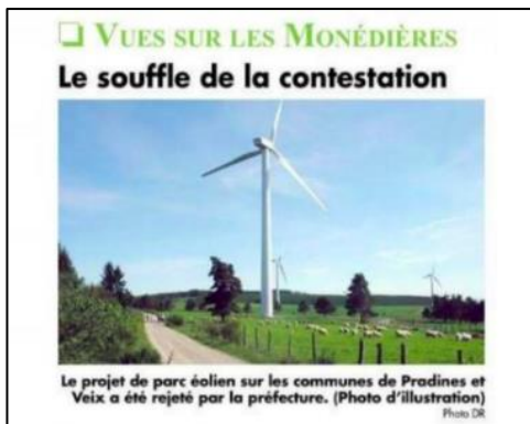
La Vie Corrézienne

Après le refus d'autorisation de ce projet par la Préfète de Corrèze, belle victoire pour nos amis de l'association « Vues sur les Monédières », dont les arguments, la détermination et la mobilisation ont convaincu les services de l'Etat, le promoteur Engie green n'a pas déposé de recours et le projet est donc abandonné .