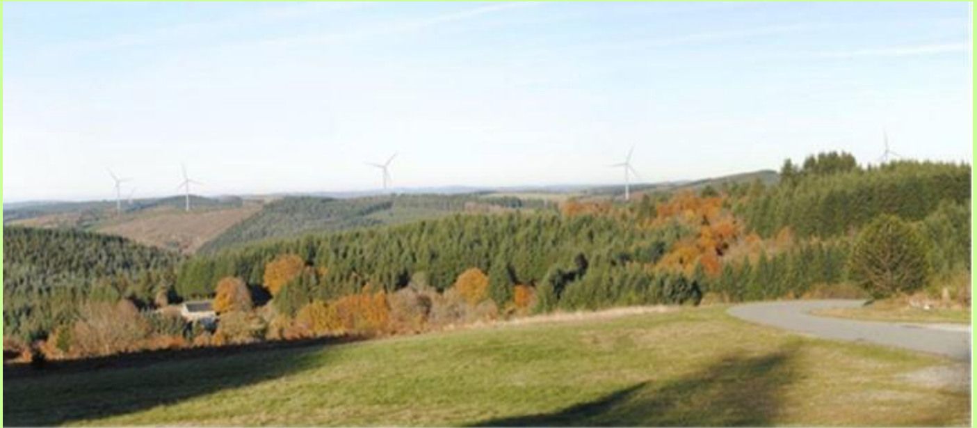
Photo-montage Eoliennes depuis le Suc au May